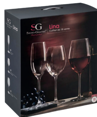
Coffret Verres 18 pièces LINA