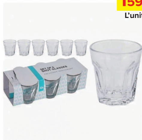
Set Verre à Liqueur 40 ML

*DISPONIBLE UNIQUEMENT À CARREFOUR MARKET SALY