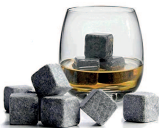
Lot de 9 Pierres à Whisky

*DISPONIBLE UNIQUEMENT À CARREFOUR MARKET SALY