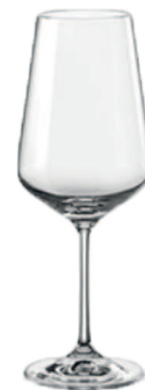
Verre à vin 45 cl Sandra

*DISPONIBLE UNIQUEMENT À CARREFOUR MARKET SALY