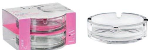
2 cendriers verre 10,6 cm

*DISPONIBLE UNIQUEMENT À CARREFOUR MARKET SALY