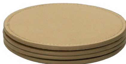
4 Dessous de verre effet doré