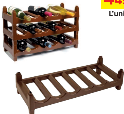
Range Bouteille A/6

*DISPONIBLE UNIQUEMENT À CARREFOUR MARKET SALY