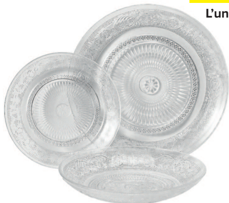
Service à vaisselle 18 pièces transparent baroque