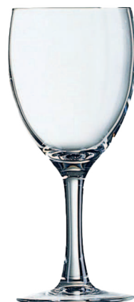
Verre à pied 19cl SMART

*DISPONIBLE UNIQUEMENT À CARREFOUR MARKET SALY