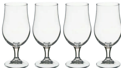
Lot de 4 Verres à bière droits 37cl

*DISPONIBLE UNIQUEMENT À CARREFOUR MARKET SALY