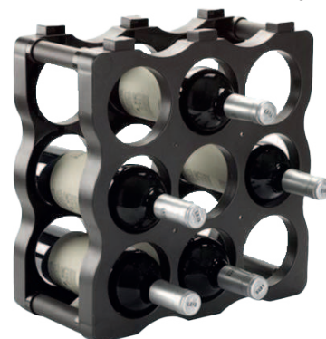
Cave à Vin 9 Bouteilles

*DISPONIBLE UNIQUEMENT À CARREFOUR MARKET SALY