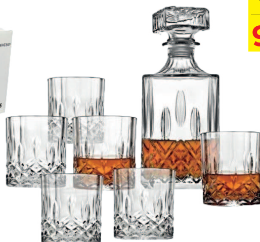
Set Whisky 7 pièces