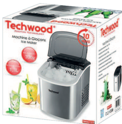
Machine à Glaçon 1,3L

PROMOTION FCFA 106000 FCFA 85990 L'unité