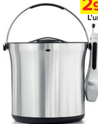
Seau à glace + Pince

*DISPONIBLE UNIQUEMENT À CARREFOUR MARKET SALY