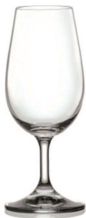
Verre à Vin 21cl Tulipe